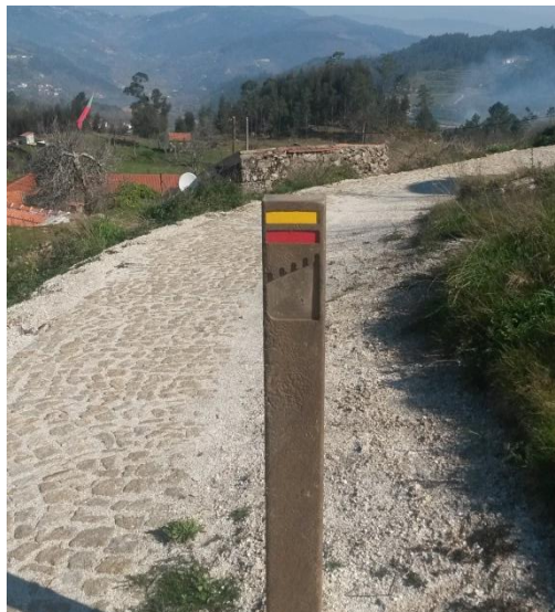
Imagem 3 - Exemplo de postes para suporte de marcas