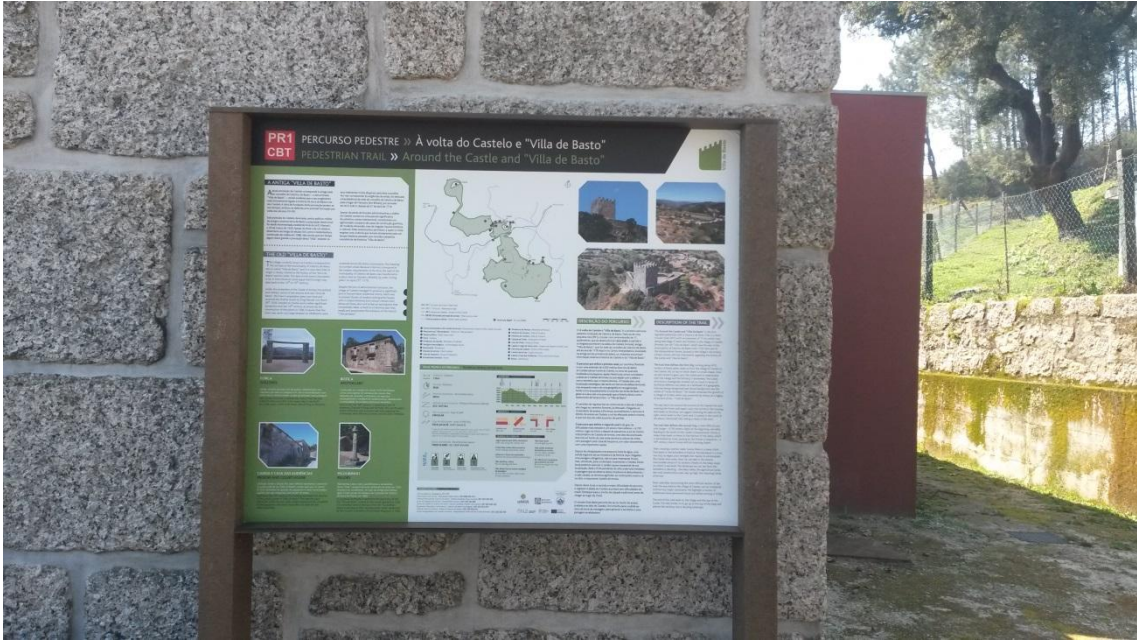
Imagem 2 - Exemplo de painéis informativos