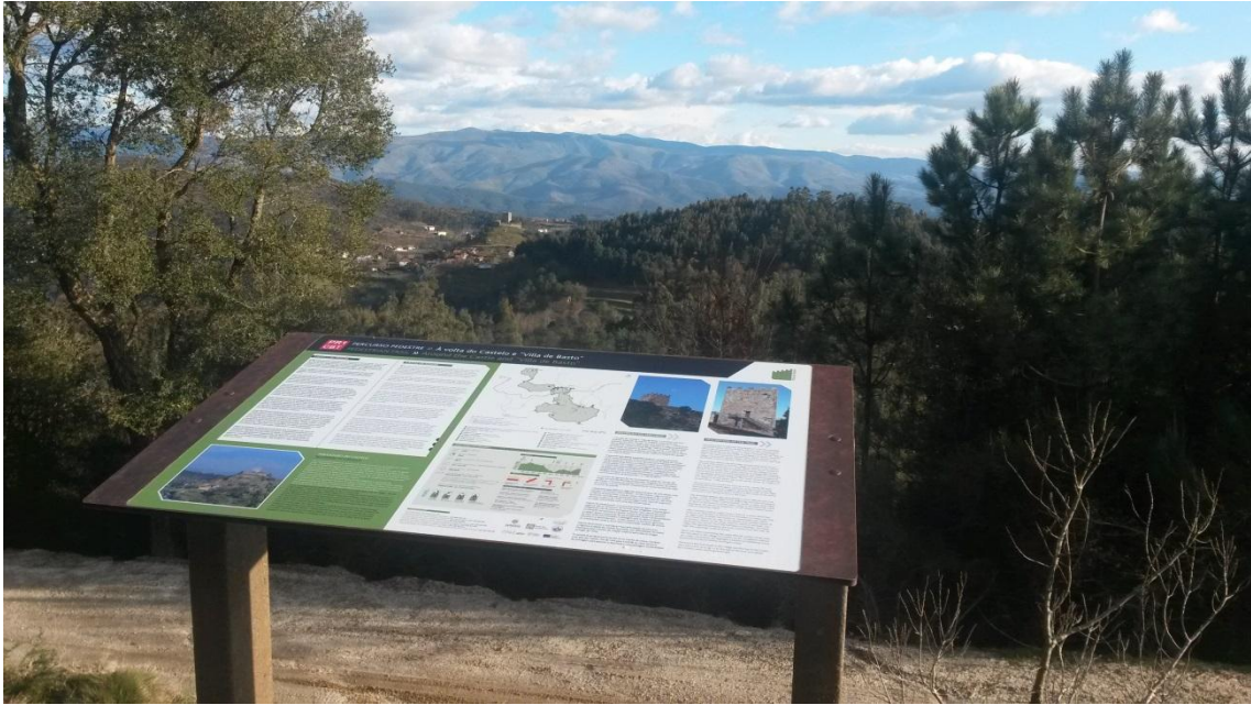
Imagem 4 – Exemplo de mesa interpretativa