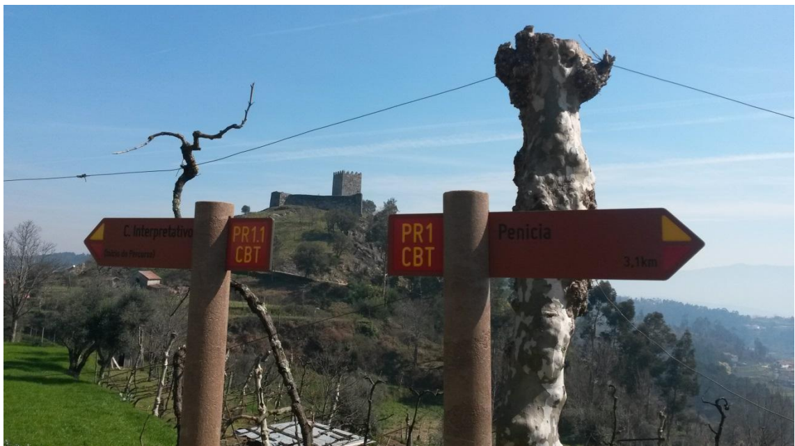
Imagem 1- Exemplo de placas indicativas do sentido do percurso