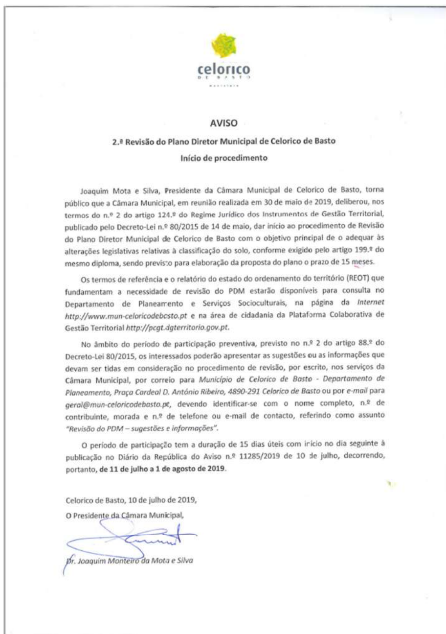
Figura 8 – Aviso de abertura do período de participação pública preventiva

O Aviso de abertura do período de participação pública preventiva foi distribuído pelas Juntas de Freguesia para ser afixado nos locais habituais. Foi também afixado no edifício da Câmara Municipal para divulgação.