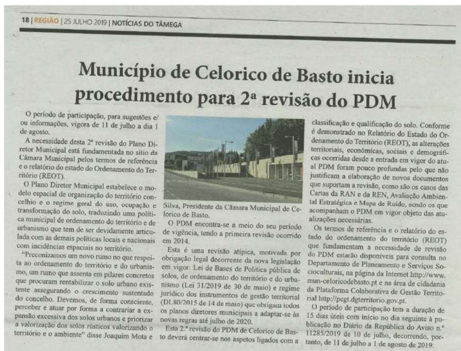
Figura 4 – Publicitação do período de participação pública no jornal regional – “Notícias do Tâmega”

O período de participação pública preventiva foi divulgado em três jornais regionais, impressa e digital.